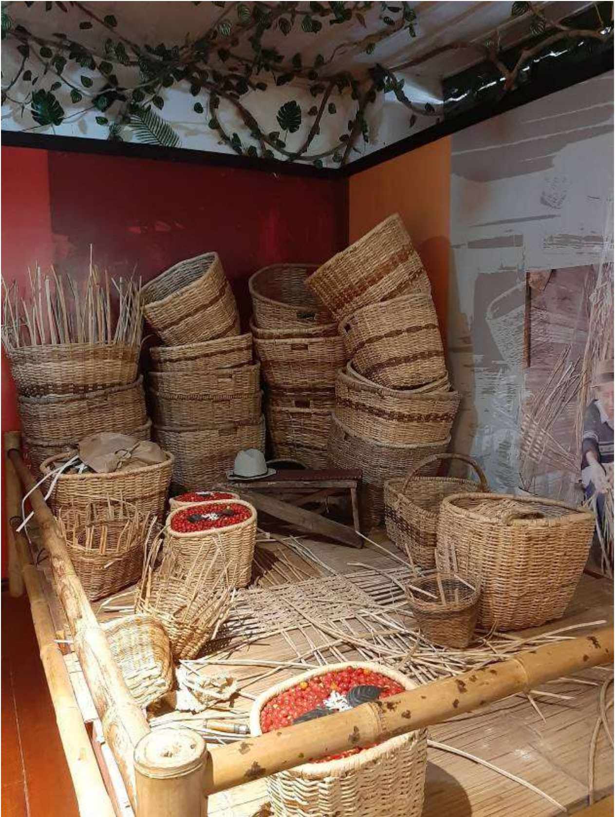
Ein Blick ins Lager des Museums