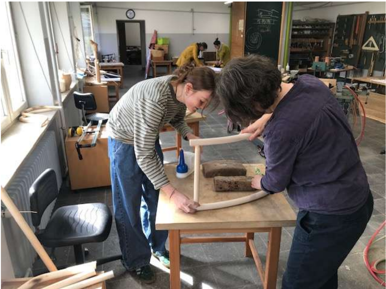
Zusammen geht's besser