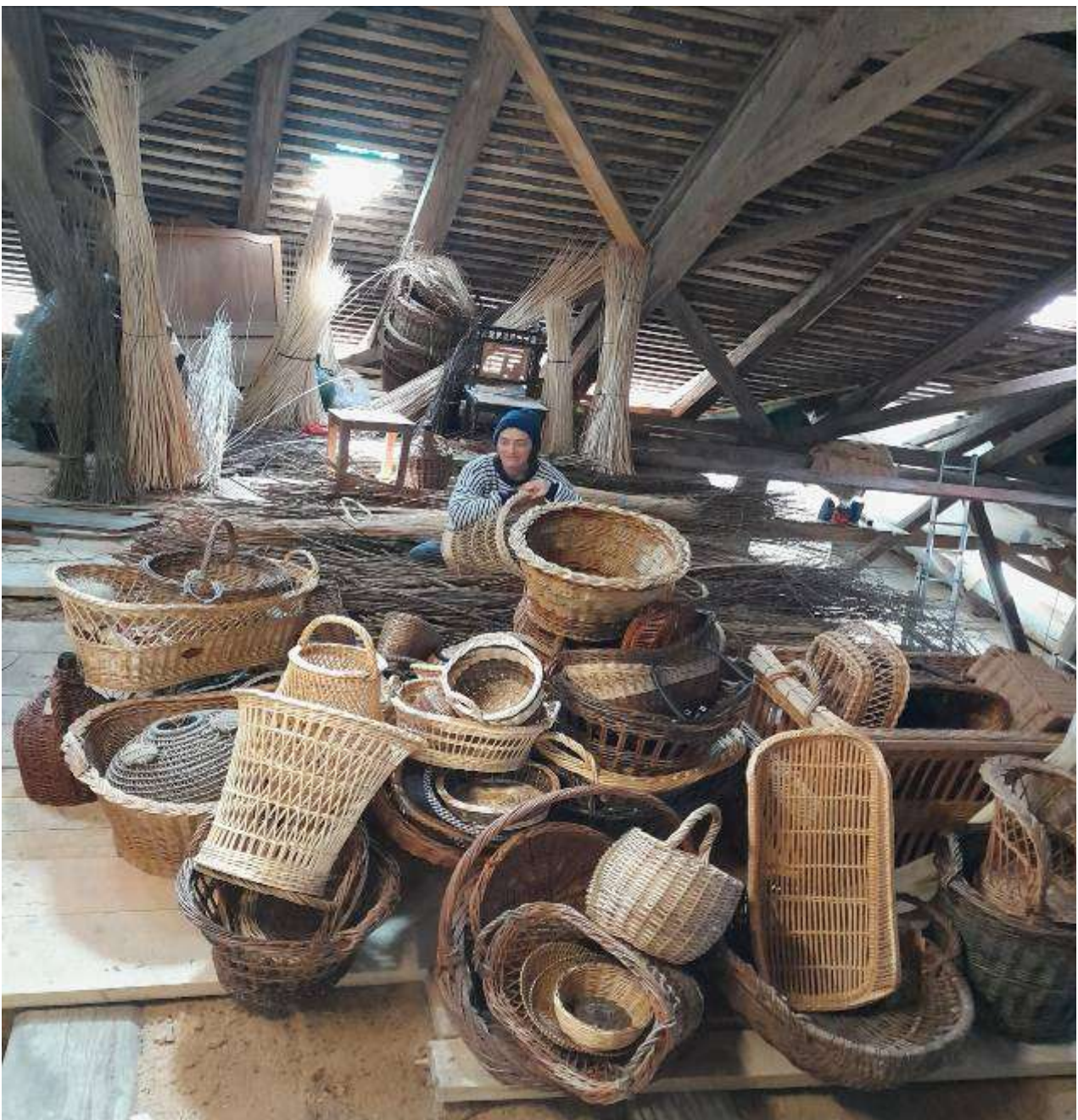
Ich und mein Chaos

Da ich nun auch vermehrt Kontakte habe mit der Welt der FlechterInnen der Schweiz und da ich merke, dass ich neuerdings gerne meine Baustellen-Jobs anderen überlasse (na ja, ein paar Wände Lehmputz mach ich schon mit Freude), werde ich mich also nochmals mit neuem Elan ins Körbe flechten stürzen.