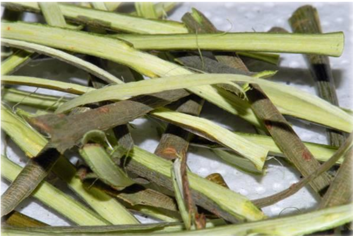
Weidenrinde, Salicis cortex , frisch abgeschält und schonend getrocknet; die Abbildung zeigt getrocknete Rinde einer Purpurweide