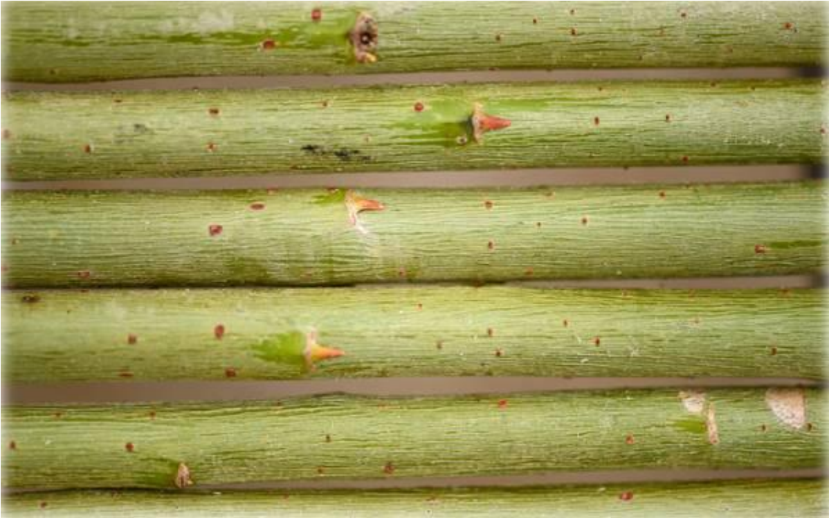
Jährige Triebe von Purpurweiden ( Salix purpurea ) eignen sich mit ihrem meist hohen Salicylatgehalt gut für die medizinale Rindenernte